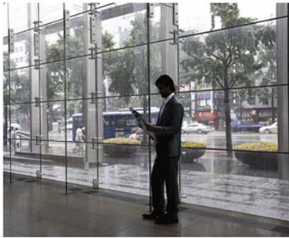
DIGITAL WDR OFF

Nuestra cámara cuenta con DWDR, esta función se encarga de medir, compensar y ajustar la luz en la imagen captada para después combinar los espacios de luces brillantes con los espacios de sombras que hay en una misma toma, creando un equilibrio en la imagen final.