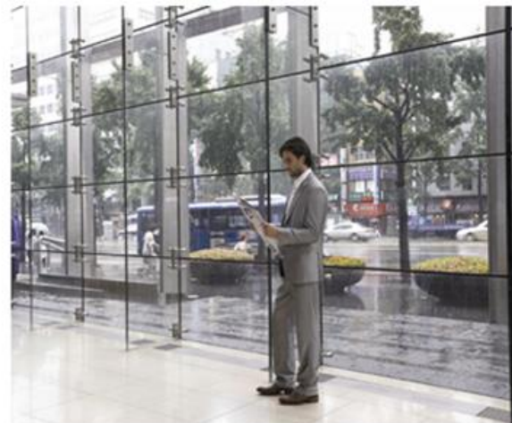
DIGITAL WDR ON