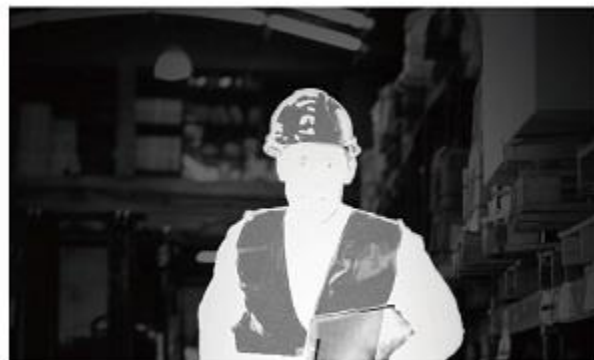
Smart IR Off