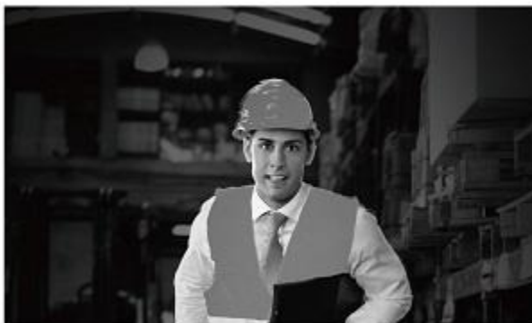
Smart IR On

La tecnología IR inteligente de VIVOTEK ajusta automáticamente la intensidad de iluminación IR y garantiza que la cámara pueda capturar videos útiles en condiciones de oscuridad, incluso cuando el objeto de interés se encuentra cerca de los LED'S IR.